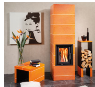
Dank der modernen Farbgebung ist dieser Kachelofen der Blickfang des Raumes. 057 02