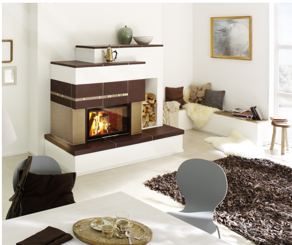
Mit großen Kacheln und dezenter Farben integriert sich dieser Kachelofen perfekt ins Wohnambiente. 057 01

Diese Textversion sowie zwei weitere Versionen können Sie im Internet herunterladen.